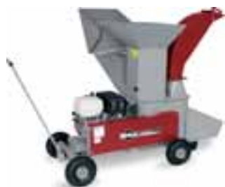
GSB 242 Combi s horním a spodním vyhadzovacím otvorem. Pohon benzinovým motorem Honda 9,6 kW, obj. č. 94562

Ještě nějaké přání? Zahradní odpadky, prořezy keřů, květináčové rostliny, řezané květiny, stromová kůra, křoví, listí, zemina atd. atd. Všechny tyto materiály lze pohodlně drtit, zpracovat a účelně znovu využít.