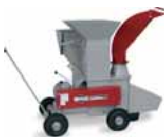
GSE 242 Combi s horním a spodním vyhadzovacím otvorem. Pohon elektromotorem 9 kW, obj. č. 94554