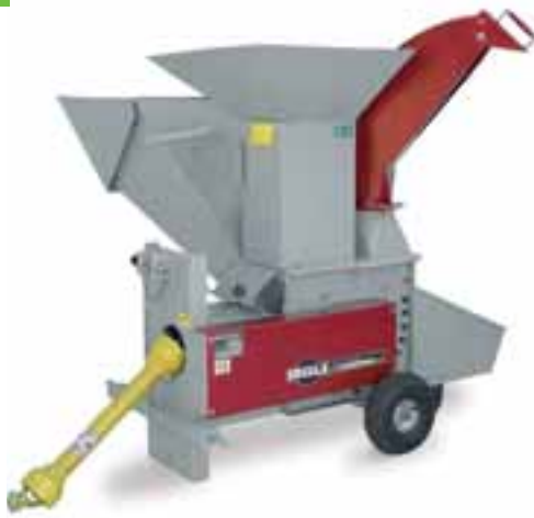
GSZ 242 Combi s horním a spodním vyhovacím otvorem. Pohon vývodovým hřídelem, obj. č. 94556

Kloubovou hřídel je možné dodat jako příslušenství za příplatek!